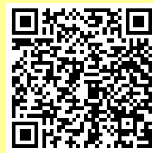
QR Code โหลดเอกสาร